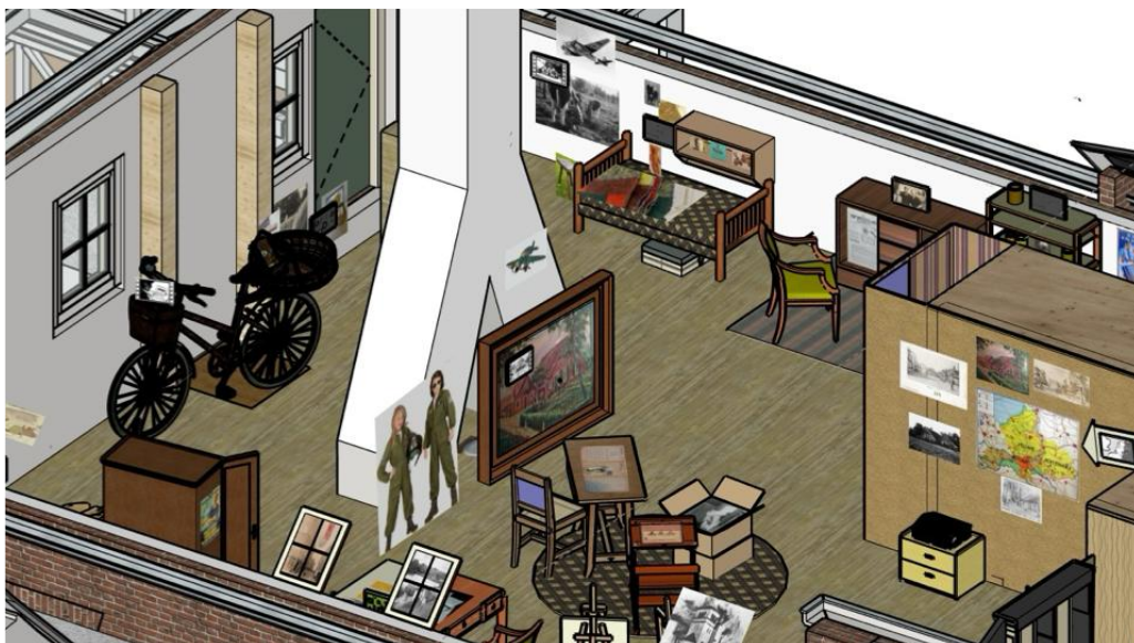
Impressie van de inrichting voor Onderduikmuseum Junior (ROO Ontwerpers)

In werkgroepverband wordt ook gewerkt aan een concept voor de Context Tentoonstelling en de Rode Draad Onderduiken. Binnen de bestaande begroting voor bedrijfsvoering wordt voor de dorpsboerderij de beleving van 'Onderduiken op de boerderij' en 'Oorlog en vrede' door de tijd heen aan de grens (archeologie in de kelder) voorbereid.