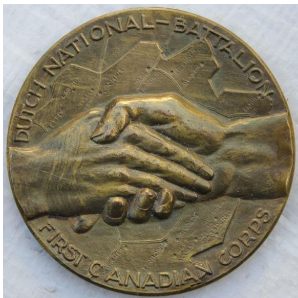
Vriendschap - Het veelzeggende beeldmerk van Dutch National Battalion