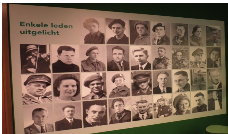
Expositie DNB

Veel DNB-leden werden in het najaar van 1944 lid van de Nederlandse Binnenlandse Strijdkrachten, waren betrokken bij de geallieerde Wapendroppings en oefenden met wapens. De Achterhoek werd rond