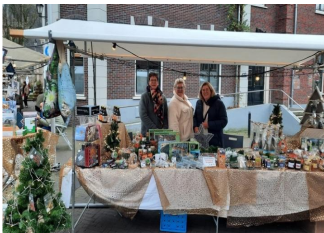
Onze kraam op de Winterfair in Aalten

De nieuw uitgebrachte fietsroute ' Ode aan het landschap ' is als enige Nederlandse fietsroute in november 2025 genomineerd als fietsroute van het jaar 2026. De meerdaagse route beslaat 368 kilometer en voert langs de indrukwekkende diversiteit van het Achterhoekse landschap. 'Ode aan het landschap' is bij de VVV verkrijgbaar als route en is tevens als boek uitgegeven.