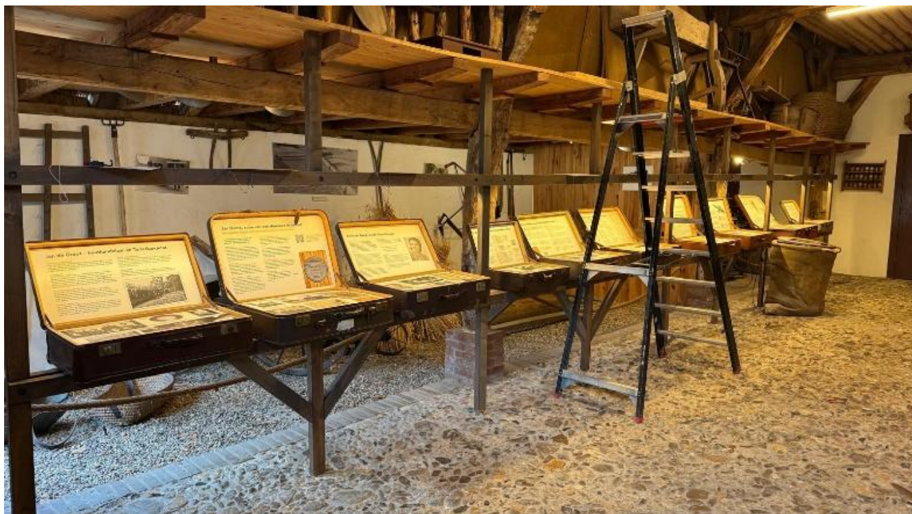
Koffers met verhalen in de Dorpsboerderij

Ook is de audiotour uitgebreid, zodat de bezoeker deze ook in de boerderij kan gebruiken.