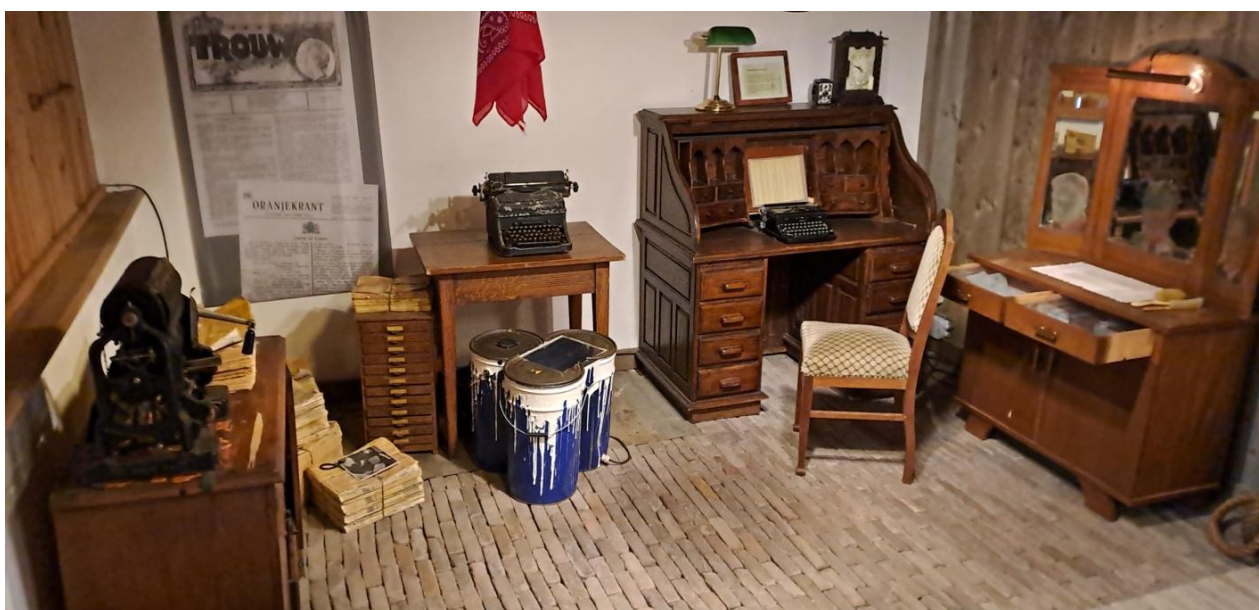
De illegale drukkerij, die voorheen op de zolder van Markt 12 stond, ondergebracht in de Dorpsboerderij

Het klusteam kijkt terug op een jaar waarin we ons met veel passie hebben ingezet voor het museum en de verschillende projecten. We bedanken iedereen voor de samenwerking en ondersteuning.