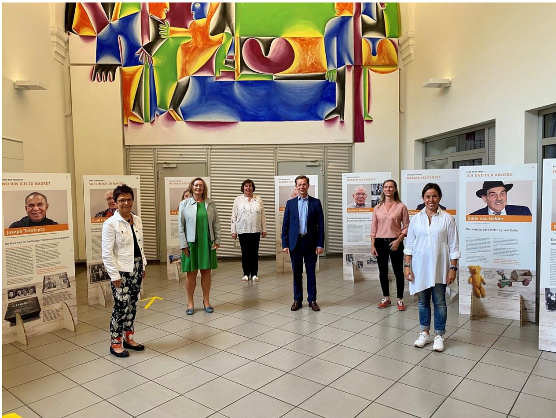
Opening in coronatijd 'reizende' Expositie 'Kind van de Vrijheid' in het Medienzentrum in Bocholtz 14.9.2021

Ook in het jaar 2021 werden we door het coronavirus geconfronteerd met periodes van lockdown en met restricties en beperkingen. Daarom werd besloten om de tentoonstelling 'Kind van de Vrijheid' (startdatum 4 april 2020) door te laten lopen tot begin 2022.