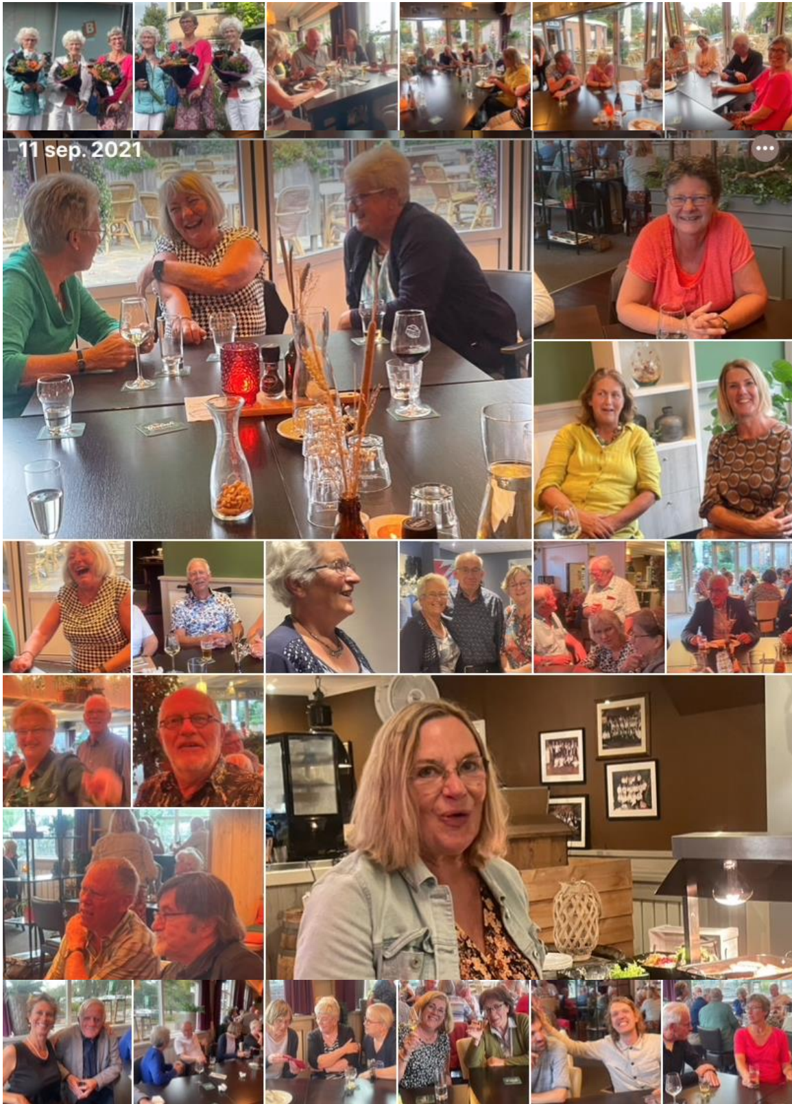
Vrijwilligerstreffen 11 september 2021