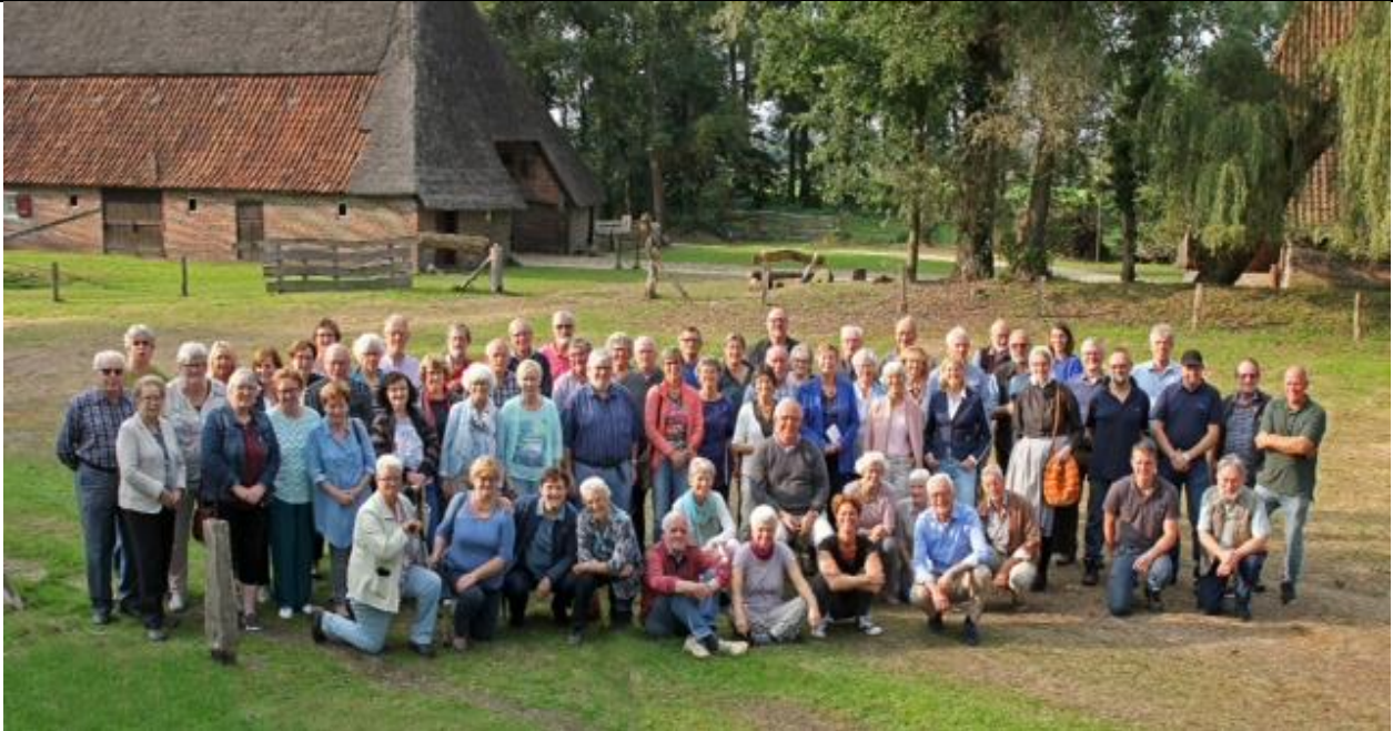
Foto: Het menselijk kapitaal van de vereniging, vrijwilligers, medewerkers en bestuur. Een deel daarvan is hier op werkbezoek

Ook het jaarverslag, met bijdragen van verschillende personen is bij de ingang te vinden en evenzeer op de site te vinden.